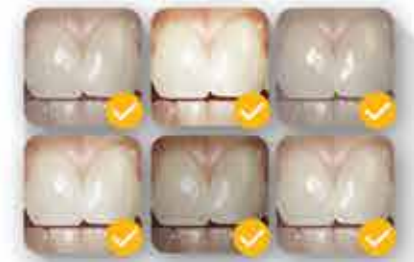
Schéma de teintes intelligent

BRDF : distribution bidirectionnelle de la réflectance